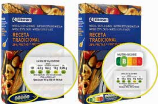
Al semáforo nutricional (izquierda) se suma ahora en Eroski el etiquetado Nutri-Score.

No obstante, conviene recordar que Nutri-Score no sirve para comparar productos distintos, como unas galletas con un yogur o un queso con un bollo. Sí puede ser útil, sin embargo, para valorar distintas opciones de alimentos que van a emplearse con el mismo fin, como cereales y galletas para desayunar.