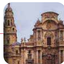
MURCIA: >Valorac.: REGULAR

Lo peor: La dejadez en labores de limpieza de las calles (pavimentos sucios y solares abandonados), además de las humedades, cañerías rotas o cables de la luz descolgados por las fachadas. Abundancia de bares de copas y discotecas.