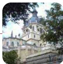
MADRID: >Valoración: BIEN

Lo peor: Limpieza mejorable de sus calles.