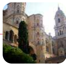
MÁLAGA: >Valorac.: ACEPTABLE

Lo peor: El importante volumen de tráfico que sufren las ocho calles analizadas.