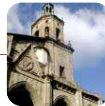
VITORIA: ➤Valorac.: ACEPTABLE

Lo peor: Excesiva presencia de locales de copas, restaurantes y discotecas.