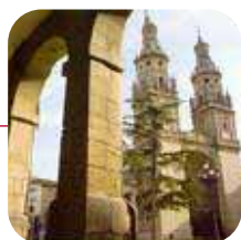
LOGROÑO: >Valorac.: ACEPTABLE

(1) Limpieza y mantenimiento: se ha observado el estado de limpieza y mantenimiento del mobiliario urbano, así como de los edificios ubicados en el casco histórico. Además, se tuvo en cuenta el estado del pavimento (si tenía gravilla, basura o era resbaladizo), pasos de peatones, parques infantiles y aseos públicos (si es que existían). (2) Servicios: se comprobó si los cascos históricos estaban equipados con los servicios mínimos exigidos por cualquier habitante de la ciudad, es decir (centros de salud, para la tercera edad, farmacias, comercios...) o si, por el contrario, se utilizaban como zona de ocio nocturno. (3) Movilidad y accesibilidad: se comprobó la existencia de obstáculos para el viandante o el conductor. Además, también se observó si estas zonas antiguas eran accesibles para tanto para discapacitados como para personas mayores. (4) Mobiliario urbano: se comprobó que el casco antiguo estuviese equipado con los mismos elementos (papeleras, contenedores, bancos, farolas, fuentes, etc.) que se instalarían en zonas más modernas de la ciudad.