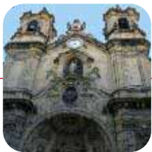
SAN SEBASTIÁN: ➤Valorac.: ACEPTABLE

Casi el 60% de las calles estudiadas no disponían de señales o paneles de situación . En concreto, no se encontró ninguno en A Coruña, Bilbao ni San Sebastián. Dentro de ese 40% de los casos que sí disponían de este tipo de paneles, los de Vitoria suponían un obstáculo o riesgo para el viandante y, al igual que los de Málaga, tenían algún elemento peligroso (fragmentos salientes sin base en el suelo o con esquinas o aristas).