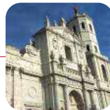
VALLADOLID: ➤Valoración: BIEN

Lo peor: Su deficiente estado de limpieza y mantenimiento. Suspende tanto en el estado del pavimento (había suciedad y elementos peligrosos), como en el de las viviendas (se observaron muchas pintadas y carteles).