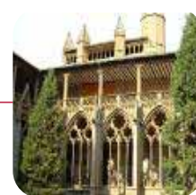
PAMPLONA: >Valoración: BIEN

Lo peor: Se encontraron coches estacionados en zonas prohibidas y el 20% de los vehículos de reparto observados estaban circulando o aparcados en zona peatonal fuera de las horas de carga y descarga.