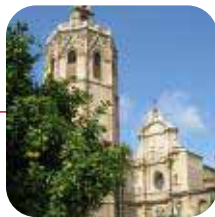
VALENCIA: ➤Valoración: REGULAR

Lo peor: Deficiente equipamiento comercial de sus calles se refiere. No se vieron centros para la tercera edad ni tampoco parques infantiles.