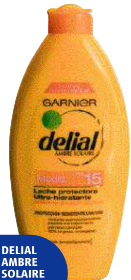
DELIAL AMBRE SOLAIRE GARNIER

Prueba de uso: la mitad de los usuarios opinan que su perfume es agradable y su textura fluida y ligera, mientras que la otra mitad lo critican por lo débil de su perfume y por su textura espesa y grasa. Todos los encuestados consideran que es fácil de aplicar, si bien cuesta que penetre en la piel. Intención de compra. Baja: solo un 20% de los consumidores lo comprarían.