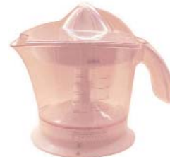
BRAUN "Citromatic MPZ9" 21,53 euros