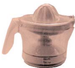
PHILIPS "Cucina HR2744" 19,55 euros