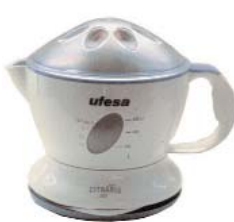
UFESA "Citraris EX7233" 17,22 euros, el más barato