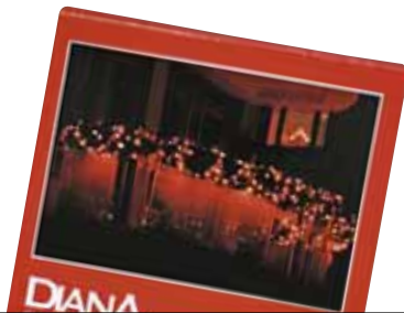
DIANA 8510045 Pinu adarren itxura duen girlanda

Transformadoreak ez du potentzia adierazten (zenbat watt). Kanpoan erabil liteke.