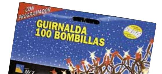
MUNDO 54021 Koloretako bonbiladun girlanda

Intermitentea. LED lanparak ditu. Letra tamaina arauak dioena baino txikiagoa da. Bonbilla bakoitzekiko elektrizitate gutxien gastatzen duenetariko.