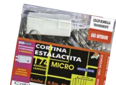
REILA LIGHTS 55174201 Argi zuridun errezela

Intermitentea. Kolore gorriko bonbilak ditu. Letra tamaina arauak esaten duena baino txikiagoa da. Kontsumo elektriko altuenetakoa du bonbilla bakoitzeko.