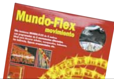
MUNDO FLEX 0161600/C Argi zuridun mahuka

Intermitentea. Letra tamaina arauak esaten duena baino txikiagoa da. Barruan erabiltzeko den arren, kutxan kanpoko irudiak agertzen dira. Elektrizitate gehien kontsumitzen duen bigarrena.