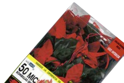
REILA LIGHTS 81050305 Pazko loredu girlanda

LED lanparak ditu. Bonbilla gutxien duenetakoa, 10. Kanpoan erabil liteke. Transformadoreak ez du watt potentzia adierazten. Elektrizitate gutxien kontsumitzen duena.