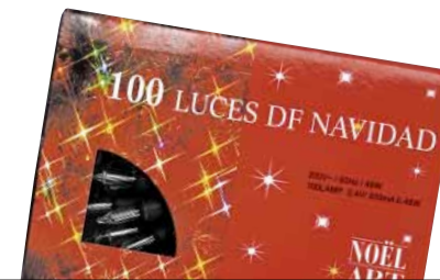
NÖEL ART 64503 Argi zuridun girlanda

Intermitentea. LED lanparak ditu. Letra tamaina arauak esaten duena baino txikiagoa da. Bonbilla bakoitzak elektrizitate gutxien gastatzen duenetakoa.