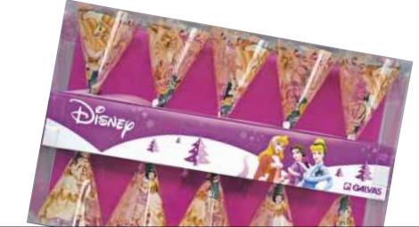
Galvas PHL-10L Disney printzesen marrazkiak dituen girlanda

Intermitentea da eta bonbillak alda litezke. Letra tamaina arauak esaten duena baino txikiagoa da.