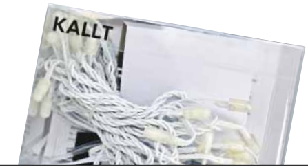
KALLT TYP J0501 SKINA Bonbila zuridun girlanda

Letra tamaina arauak esaten duena baino txikiagoa da. Transformadoreak ez du esaten zenbat watt dituen. Alemanieraz agertzen dira zenbait segurtasun aipamean baina ez gaztelaniaz.