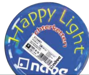
NÄVE 5134 Koloretako izardun girlanda

Intermitentea da. Kablean beharko lukeen etiketa falta zaio, segurtasun arauena. Kanpoan erabiltzeko egokia da.