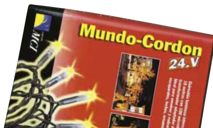
MUNDO CORDÓN 0081012 Bonbila zuridun girlanda

Musika daukan barra. Bonbillak alda litezke. Letra tamaina arauak esaten duena baino txikiagoa da. Bonbilla bakoitzak gehien gastatzen duenetakoa.