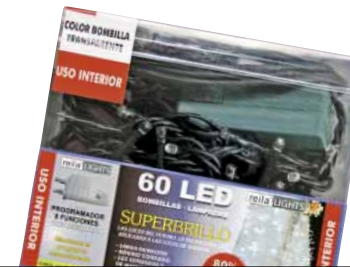
REILA LIGHTS 41060101 Argi zuridun girlanda.

Letra tamaina arauak esaten duena baino txikiagoa da. Transformadoreak ez du ze potentzia duen adierazten. Zenbait segurtasun aipamen alemanieraz ageri dira baina ez gaztelera. Kanpoan erabil liteke.