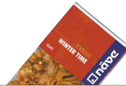
NÄVE 5242 Apaingarriak dituen girlanda

LED lanparak ditu. Transformadoreak ez du zenbat watt dituen esaten. Kanpoan erabil liteke. Bonbillako elektrizitate gutxien gastatzen duena.