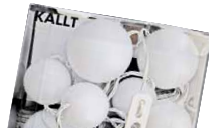
KALLT TYP J0633 GLÄNSA Bola zuridun girlanda

Intermitentea da. Letra tamaina arauak esaten duena baino txikiagoa da. Kanpoan erabil liteke.