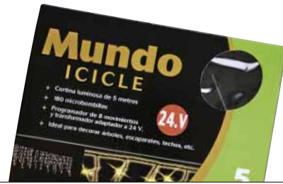
MUNDO ICICLE 0080701 Argi zuridun errezela

Bonbila gehien dituen bigarrena, 180. Intermitenteak dira. Etiketari, letraren tamaina arauak eskatua baino txikiagoa da. Kanpoan erabil daitezke.