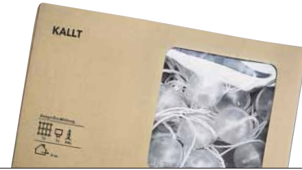
KALLT TYP J0635 Bola zuridun errezela

Bonbila gehien dituen bigarrena, 180. Intermitenteak dira. Etiketari, letraren tamaina arauak eskatua baino txikiagoa da. Kanpoan erabil daitezke.