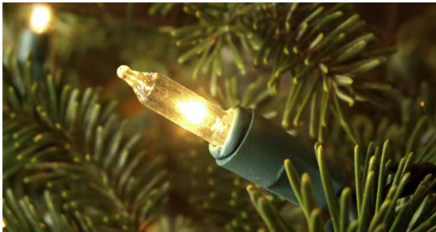
EGUBERRIETAKO 16 ARGİ-GIRLANDA AZTERTU DITUGU