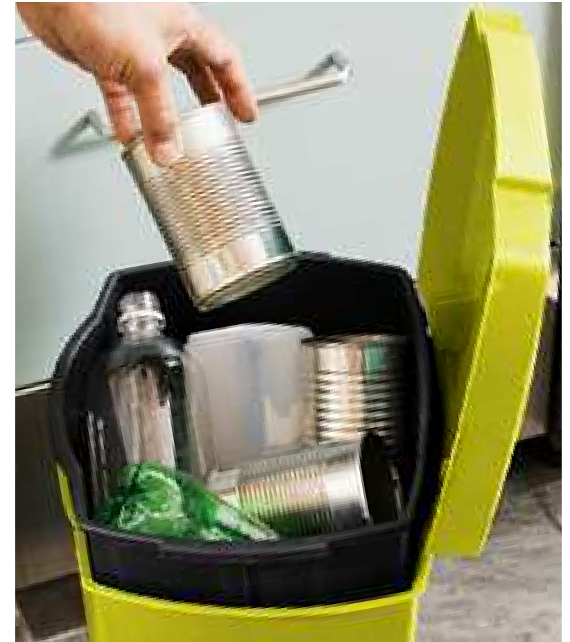
2008AN SORUTAKO HIRI HONDAKIN SOLIDOAK*

Agintarien helbururik behinena zabor gutxiago sortzeko modua egitea da, baina emaitzetan ez da halakorik ikusten: iaz bost milioi tona hondakin baino gehiago bildu zituzten 18 hiri hauetan (duela lau urte baino % 4 gehiago ia). Guk aztertu ditugun hirien artean, hiruk soilik lortu dute 2004an baino zabor gutxiago sortzea: Bilbo, Granada eta Bartzelona (hurrenez hurren, orduan baino % 6,7, % 4,3 eta % 1,5 zabor gutxiago sortu dute). Sevilla, Malaga eta Logroño daude beste muturrean; horiek 2004an baino % 16,3, % 13,5 eta % 10,8 zabor gehiago sortu dute, hurrenez hurren. Herritar bakoitzak zenbat zabor sortu duen aztertzen badugu, ez dugu aurkituko datu hoberik. 2004an, egunean 1,29 kilo zabor sortu zituen, batez beste, 17 hiri horietako herritar bakoitzak, eta 2008an, 1,32 kilo (hau da, 481 kilo urtean, orduan baino % 2 gehiago). Kordoban eta Sevillan sortzen da zabor gehien herritar bakoitzeko (1,52 kilo eta 1,48 kilo egunean), eta Zaragozan eta Gasteizen gutxien (1,07 kilo egunean). Nabarmenezkoa da beste datu hau ere: Sei hiriburutan ugaritu egin dira biztanleak, baina gutxitu egin da bakoitzak sortu duen zabor kopurua eta Granadan, hiritarrek zein zaborra, biak jeitsi dira. Horien artean, Bilbo aipatu behar da (duela lau urte baino % 7 zabor gutxiago sortu du bilbotar bakoitzak). Bartzelonan eta Granadan % 4 gutxitu da, Zaragozan, Gasteizen eta Alacanten % 3 eta Madrilan % 1. Sevillan, % 7 igo da eta Malaga eta Valladoliden % 10.