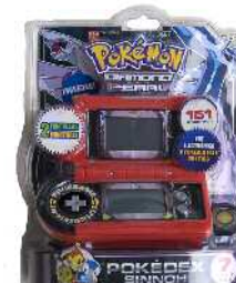
Pokemon jolas elektronikoa Zein adinetako haurrentzat proposatzen du: 6 urtetik gorakoentzat. Ez du adierazten gehienez zein adin arte erabil litekeen.