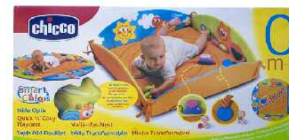
Chicco jolas manta, haurtxoentzat Zein adinetako haurrentzat proposatzen du: 0 hilabetetik gorakoentzat. Pedagogian adituen ustez gomendapena ez da erabat zuzena eta hobe liteke.