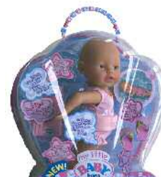
Baby Born pampina (haurtxoa) Zein adinetako haurrentzat proposatzen du: 3tik gorakoentzat, zein adin arte esan gabe.