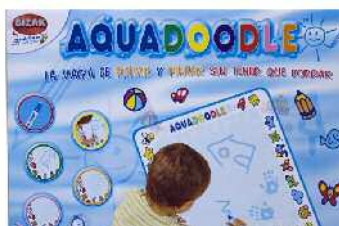
Aquadoodle marrazteko arbela Zein adinetako haurrentzat proposatzen du: 9 hilabetetik gorakoentzat. Pedagogian adituek zuzena dela diote, baina hobe litekeela.