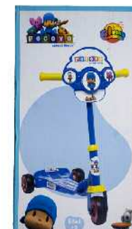
Pocoyo patinetea Zein adinetako haurrentzat proposatzen du: 6 urtetik gorakoentzat. Ez du adierazten gehienez zein adin arte erabil litekeen.