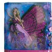
Barbie Mariposa pampina Zein adinetako haurrentzat proposatzen du: 3 urtetik gorakoentzat. Pedagogian adituek zuzena dela diote, baina hobe litekeela.