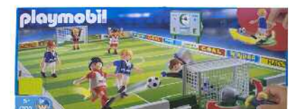
Playmobil futbol zelaia Zein adinetako haurrentzat proposatzen du: 5 urtetik gorakoentzat. Ez du adierazten gehienez zein adin arte erabil litekeen.