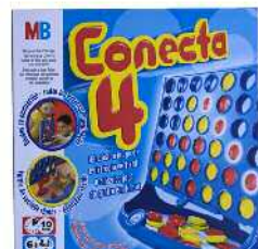
Conecta 4 mahai-jolasa Zein adinetako haurrentzat proposatzen du: 6 urtetik gorakoentzat.