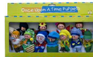
Once Upon a Time Edurnezuriren txotxongiloak Zein adinetako haurrentzat proposatzen du: ez du ezer esaten.