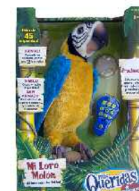
Loro Molón loro soinuduna Zein adinetako haurrentzat proposatzen du: 5 urtetik gorakoentzat.