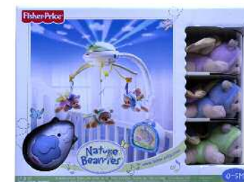
Fisher Price sehaska zintzilikaria Edad indicada: 0-5 meses.