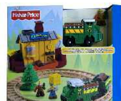
Geo-Trax jostailuzko tren Zein adinetako haurrentzat proposatzen du: 3 urtetik gorakoentzat. Pedagogian adituek zuzena dela diote, baina hobe litekeela.