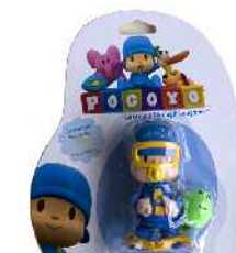
Pocoyo bainuko pampina Zein adinetako haurrentzat proposatzen du: 18 hilabetetik gorakoentzat. Ez du adierazten gehienez zein adin arte erabil litekeen.