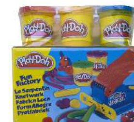
Play-Doh plastilina jolasa Zein adinetako haurrentzat proposatzen du: 3 urtetik gorakoentzat. Ez du adierazten gehienez zein adin arte erabil litekeen.