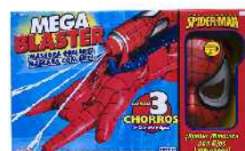
Spiderman maska argiduna eta eskularrua Zein adinetako haurrentzat proposatzen du: ez du ezer esaten.