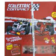
Scalextric, karrerak egiteko zirkuitua eta autoak Zein adinetako haurrentzat proposatzen du: 4 urtetik gorakoentzat.