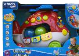
Bonny el Piloto arraste jolasa, helikoptero itxurakoa Zein adinetako haurrentzat proposatzen du: 12 urtetik gorakoentzat. Ez du adierazten gehienez zein adin arte erabil litekeen.