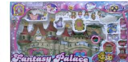
Fantasy Palace jostailuzko jauregia Zein adinetako haurrentzat proposatzen du: ez du ezer esaten.