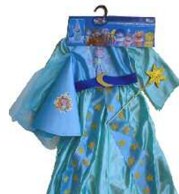
Los Lunnis-en mozorroa Zein adinetako haurrentzat proposatzen du: urte batetik 3 urtera bitartekoentzat.