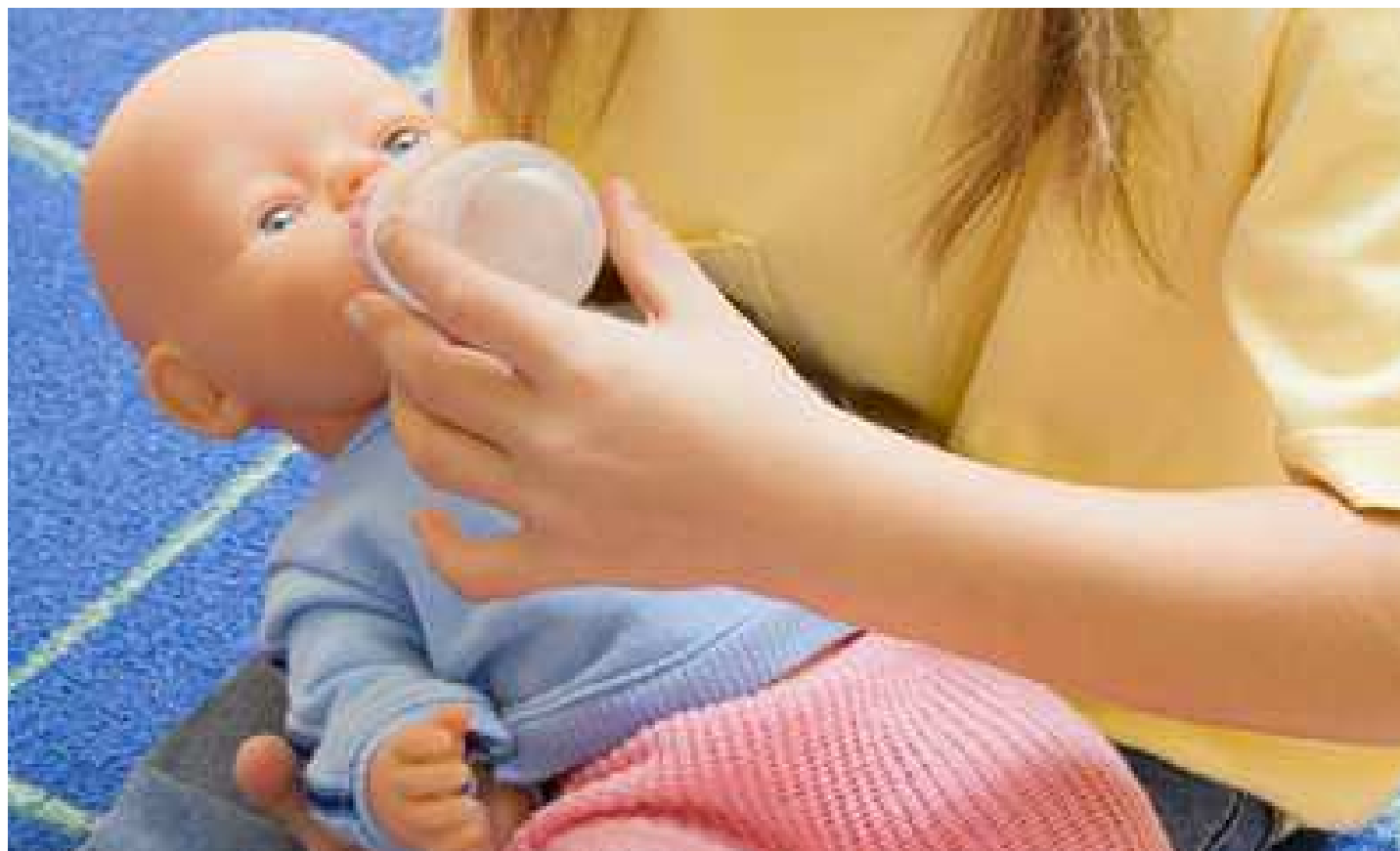
ASKOTARIKO 40 JOSTAILUREN SEGURTASUNA ETA ETIKETAK