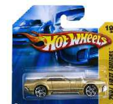
Hot Wheels metalezko autoa Zein adinetako haurrentzat proposatzen du: 3 urtetik gorakoentzat. Ez du adierazten gehienez zein adin arte erabil litekeen.