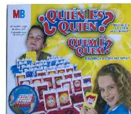
¿Quién es Quién? mahai-jolasa Zein adinetako haurrentzat proposatzen du: 6 urtetik gorakoentzat. Etiketa gaizki emana du: pieza txikiak dituela esaten du, baina irensteko arriskua dagoela esan gabe.