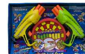
Buzz-Bee Toys, tiro trebetasuneko jostailua Zein adinetako haurrentzat proposatzen du: 6 urtetik gorakoentzat. Ez du adierazten gehienez zein adin arte erabil litekeen.