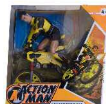
Action Man pampina, mendi bizikletaduna Zein adinetako haurrentzat proposatzen du: 4 urtetik gorakoentzat. Ez du adierazten gehienez zein adin arte erabil litekeen.