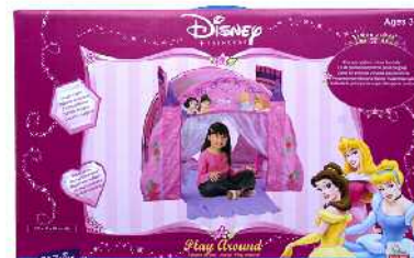
Disney tunela, desmuntatzekoa Zein adinetako haurrentzat proposatzen du: 3 urtetik gorakoentzat. Ez du adierazten gehienez zein adin arte erabil litekeen.