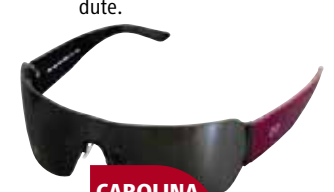
CAROLINA HERRERA 212-2388

Ez dute eman nabarmentzeko moduko emaitzarik.