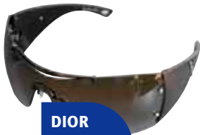
DIOR DIORITO 2 LRVJN

Leiar polarizatua. UVA eta UVB izpi gutxien pasatzen uzten duten artean daude.