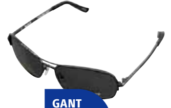
GANT HAVASU SI-3P

Iragazki progresiboa. 2 mailakoan artean UVB izpi gutxien pasatzen uzten dituzten artean daude.