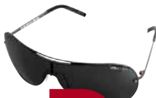
OXYDO X-STEEL2 6LBN2

UVA erradiazio gutxien pasatzen uzten duten artean daude. UVB izpiak erabat oztopatzen dituzte.