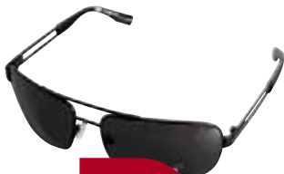
HUGO BOSS 0063/S