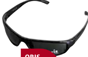
ORIS A126 COL01

Merkeenak. Iragazki progresiboa. UVA izpi gehien pasatzen uzten direnak dira eta hiru mailakoan artean gutxien babesten dutenak UVB izpien aurrean