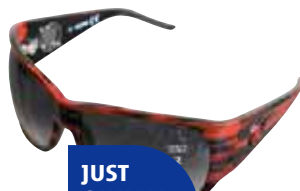
JUST CAVALLI JC144S U3

Garestienak Iragazki progresiboa. Bi mailakoan artean emaitza kaskarrena eman dutenak zaharkitzea proba egin zaienean.