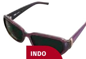
INDO 5089 CA-1537

Iragazki progresiboa. Hauxek dira UVB eta argi izpi gehien pasatzen uzten dutenak.