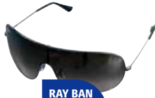
RAY BAN 3311

Kalitate-prezio harreman onena. Iragazki progresiboa. Zaharkitzea lasterraragotu dugunean, emaitza onena eman dutenak.