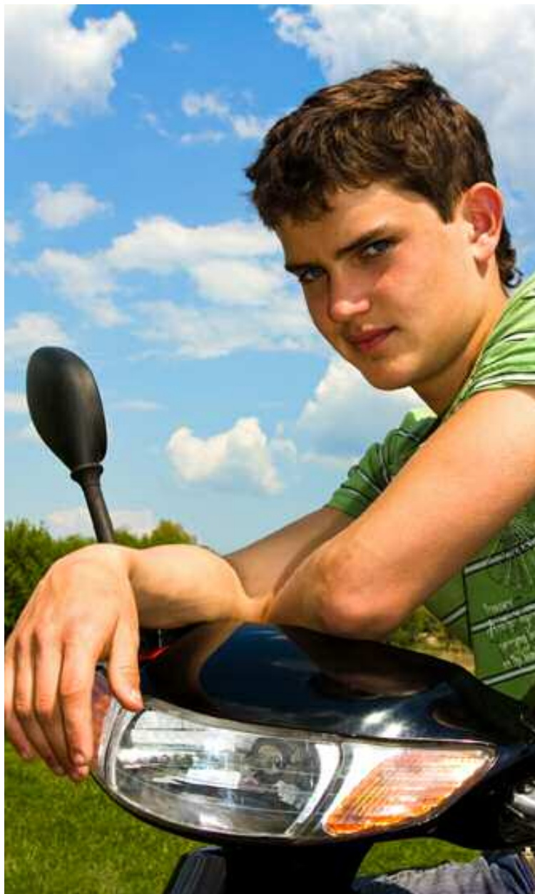
PRECIOS MEDIOS DEL SEGURO A TERCEROS BÁSICO SEGÚN EL PERFIL DEL CONDUCTOR Y LA CIUDAD EN LA QUE SE CONTRATE. Datos de diez compañías obtenidos en la prueba realizada por CONSUMER EROSKI