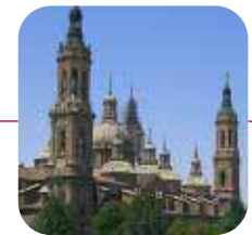
ZARAGOZA: ➤Valoración: BIEN

Lo peor: Sobreabundancia de bares de copas y discotecas, que no ayudan a mejorar la habitabilidad ni a mantener sus calles limpias.