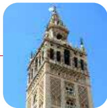
SEVILLA: ➤Valorac.: ACEPTABLE

Lo peor: Más orientado hacia el turista que hacia el residente.